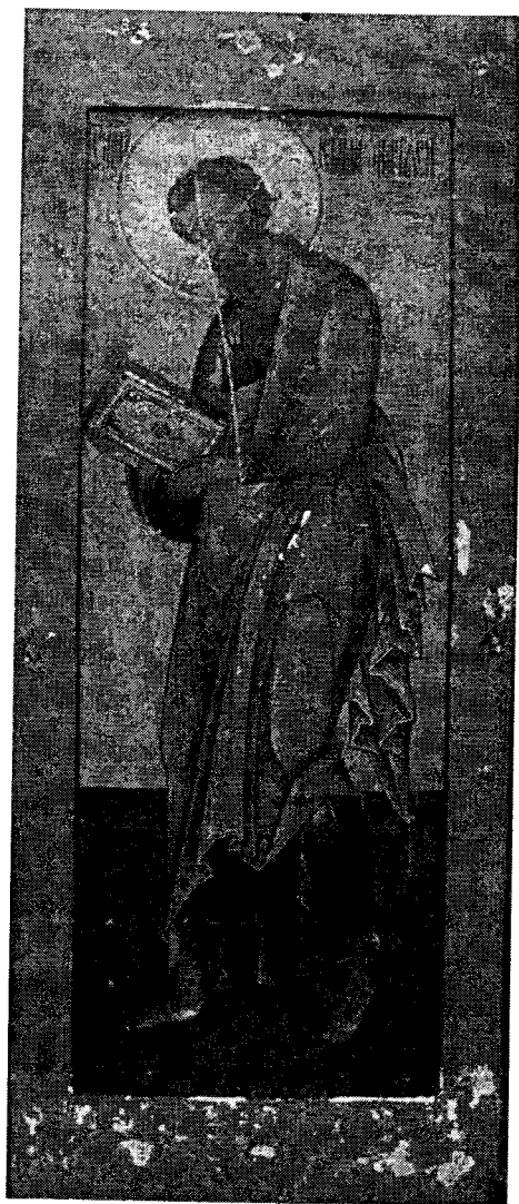
3. Икона «Апостол и евангелист Матфей». Карельский музей изобразительных искусств.

В фондах Карельского музея изобразительных искусств хранятся 13 икон деисусного апостольского чина (Инв. номера с И-1349 по И-1361), происходящие из часовни деревни Верхний Конец близ