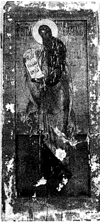
1. Икона «Пророк Иезекииль» (до реставрации). УЦИММ А.В. Журавского.